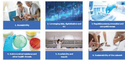
Приоритети на EMA до 2028 г.

сигурност на доставките с лекарства; Устойчивост на европейската мрежа.